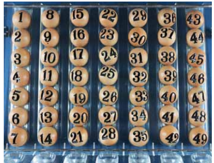
Las primeras bolas que se utilizaban en los sorteos eran de madera de boj.

importes de muchas cifras que no nos sorprenden en EuroMillones, pero sí en cualquier otro juego. De hecho, el anterior récord de La Primitiva era de 67.109.043,20 euros, así que la diferencia es bastante importante.