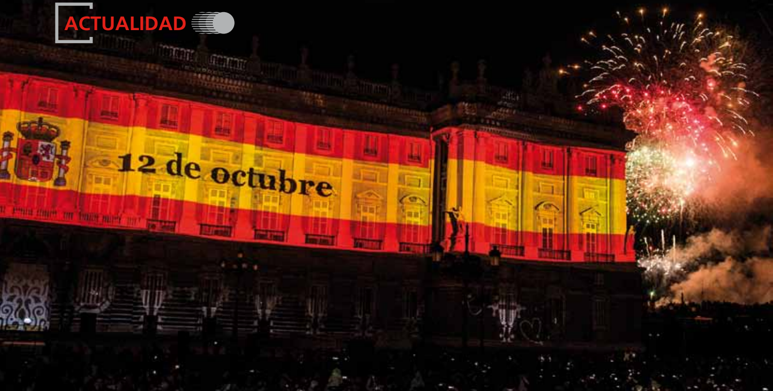
El espectáculo de luz y sonido frente al Palacio Real de Madrid, seguido por centenares de personas, finalizó con una sesión de fuegos artificiales.