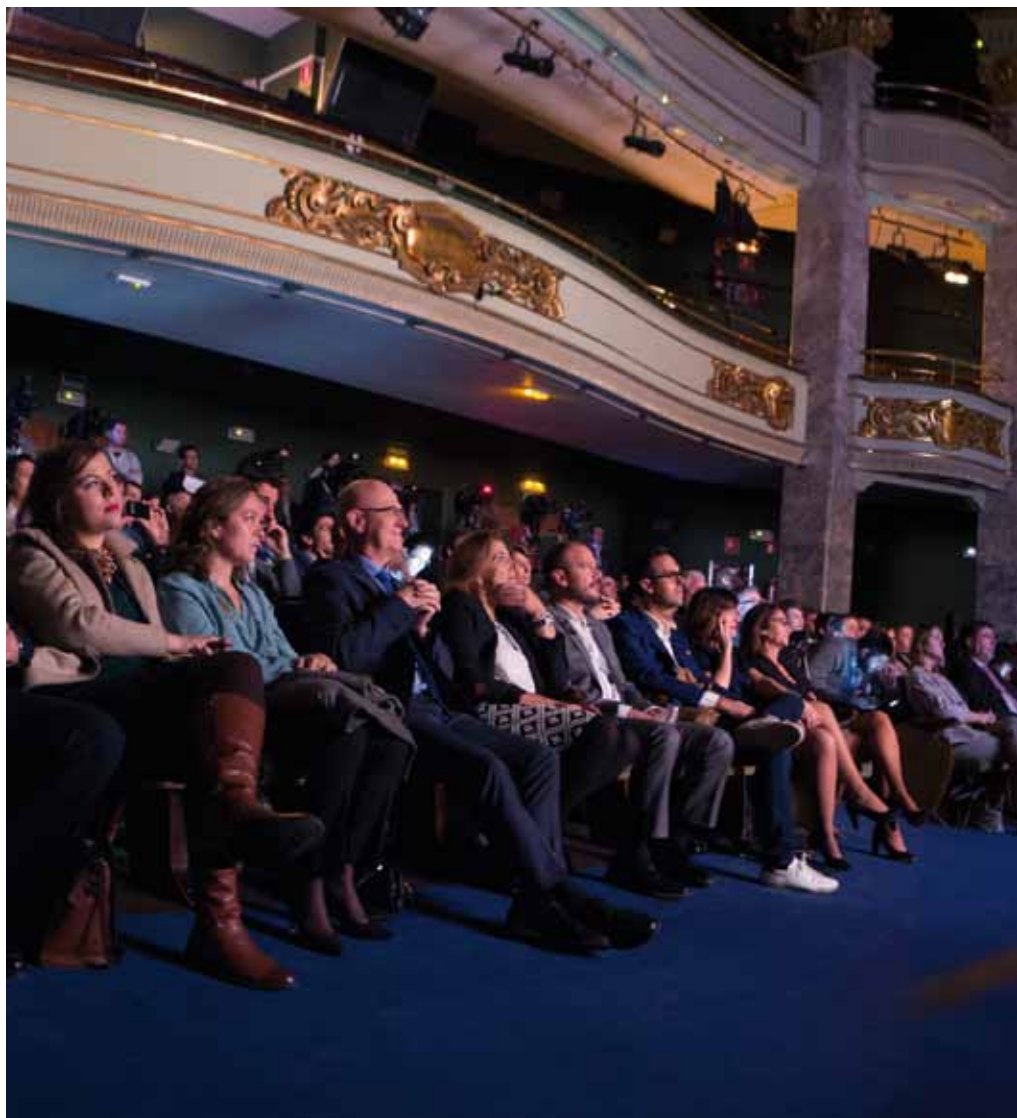
Había una gran expectación por conocer la campaña de este año, tras el éxito de la anterior.

El acto de presentación del Sorteo de Navidad y de la campaña que lo apoya tuvo lugar el 16 de noviembre en la sede del Círculo de Bellas Artes de Madrid.