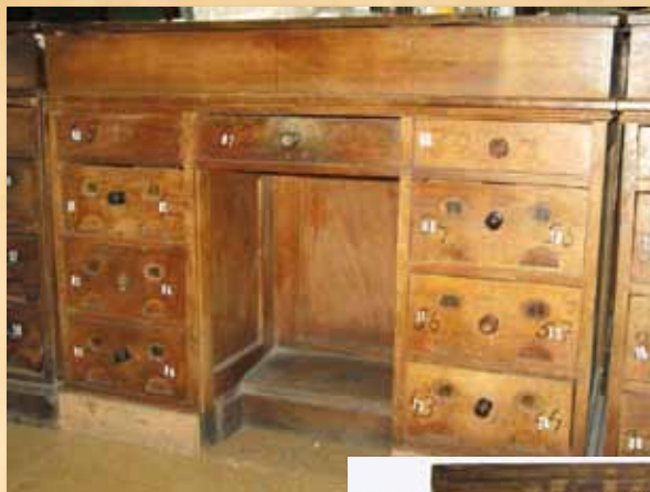
Mesa clasificadora antes de su restauración.