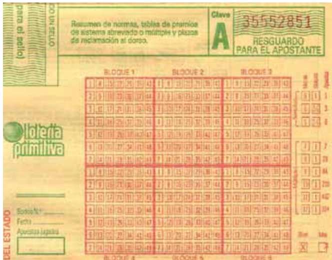
Resguardo para el apostante de un boleto antiguo de La Primitiva.