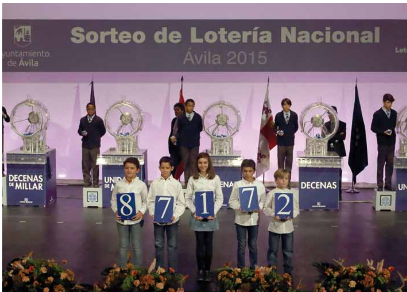
Niños y niñas del Colegio Diocesano de la Asunción de Nuestra Señora de Ávila muestran el número agraciado con el primer premio.