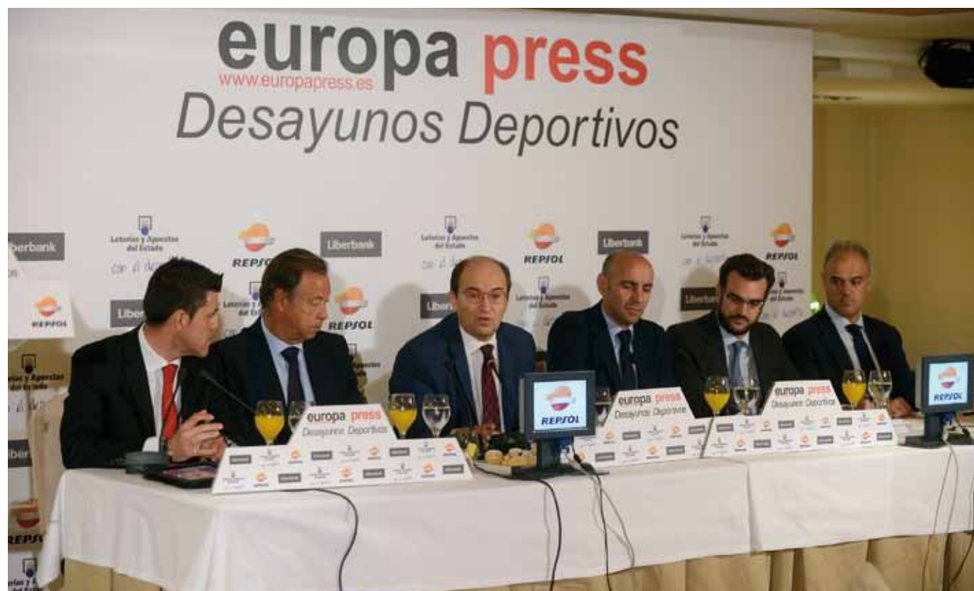
El Presidente y el Director Deportivo del Sevilla FC (en el centro) protagonizaron el primer Desayuno Deportivo de la temporada (foto: Europa Press).

ñaló que el Sevilla siempre ha sido un club canterano, lo cual ha supuesto "un sustento y una tabla de salvación" en momentos de dificultades económicas: "Intentamos tener siempre esa autopista entre la cantera y el primer equipo". En su opinión, es muy importante descubrir nuevos valores que, en el futuro, puedan aportar plusvalías, aunque recordó que "la mejor plusvalía es el éxito deportivo". "Monchi" reconoció que el Sevilla no puede competir en el mercado de fichajes con los principales equipos de Europa, pero sí con otros similares a él, como la ACF Fiorentina, la SSC Napoli o el Olympique Lyonnais. "Cuando el jugador escucha 'Sevilla', sabe que puede competir por algo importante y se acuerda de futbolistas que