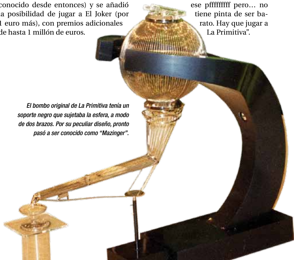
El bombo original de La Primitiva tenía un soporte negro que sujetaba la esfera, a modo de dos brazos. Por su peculiar diseño, pronto pasó a ser conocido como “Mazingher”.

La publicidad de La Primitiva también ha ido evolucionando con el paso del tiempo, desde aquel Millones a cinco duros al actual No tenemos sueños baratos . Con este lema, la agencia Publicis ha lanzado un nuevo spot , basado en el “¡Pffff!” que todos hemos pronunciado alguna vez al pensar en lo que haríamos si nos tocara un premio millonario. Distintos personajes en diversas situaciones cotidianas (en el trabajo, en casa, estando con amigos, en el portal, haciendo deporte, hablando por teléfono, en el parque o incluso en una sauna) piensan en La Primitiva y se les escapa ese “¡Pffff!”. El spot termina diciendo: “No sabemos qué es ese pffffffffff pero... no tiene pinta de ser barato. Hay que jugar a La Primitiva”.