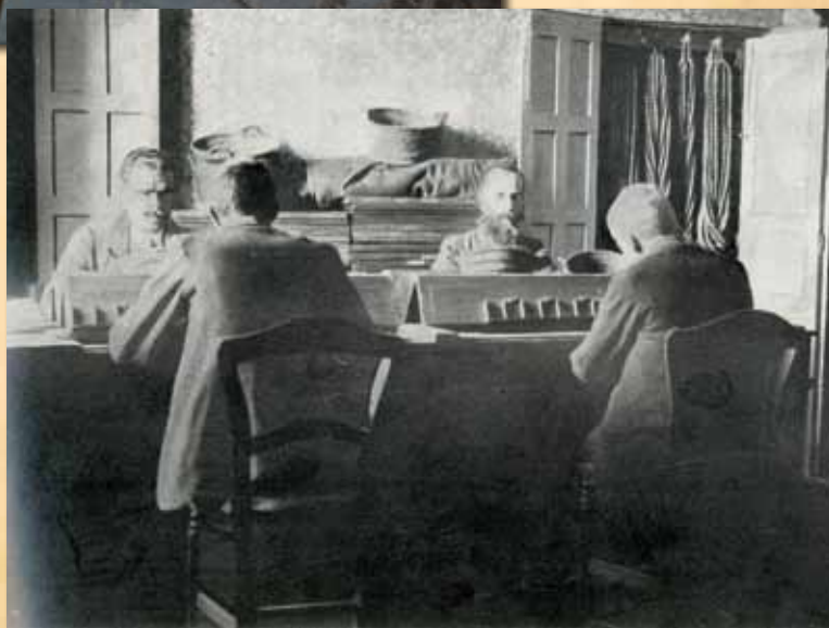
Recuento y ordenación de bolas en las mesas clasificadoras.