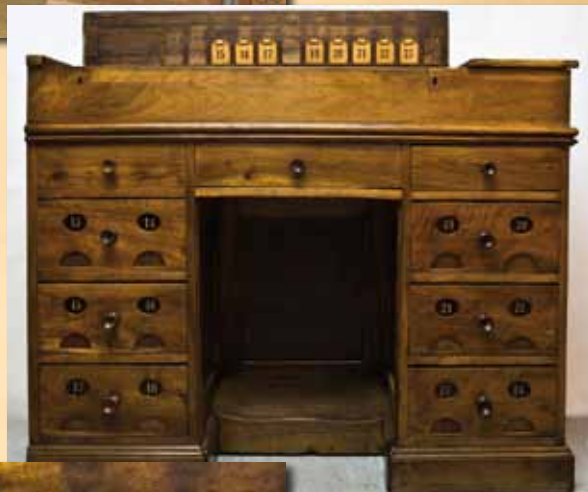
Mesa clasificadora expuesta, tras su restauración, con motivo de la celebración del 250º aniversario de Loterías.