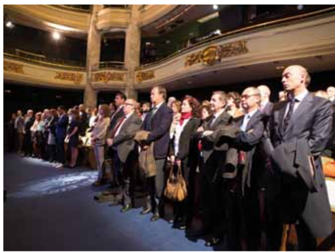
Puestos en pie, todos guardaron un minuto de silencio por las víctimas de París.