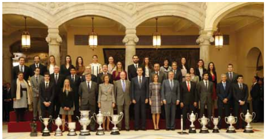
Los Premios Nacionales del Deporte consisten en un total de 13 galardones.

La Presidenta de Loterías y Apuestas del Estado, Inmaculada García, recogió el 17 de noviembre, de manos de Su Majestad el Rey Felipe VI, uno de los Premios Nacionales del Deporte. Concretamente, la Copa Stadium reconoce la especial contribución de SELAE a la promoción y el fomento del deporte español durante 2014. El acto se celebró en el Palacio Real de El Pardo, situado a las afueras de Madrid, y en él participaron también la Reina Doña Letizia y los Reyes Don Juan Carlos y Doña Sofía. Entre los premiados por el Consejo Superior de Deportes se encontraban también el piloto de motociclismo Marc Márquez y la jugadora de bádminton Carolina Marín.