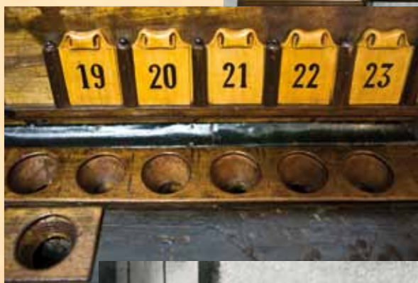
Detalle de la parte superior del mueble, por donde se introducían las bolas siguiendo la numeración de las placas de marquetería.