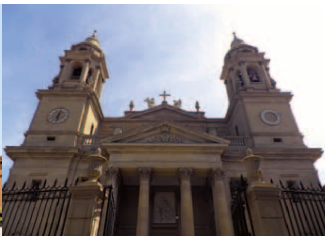
Fachada de la Catedral de Pamplona, diseñada por Ventura Rodríguez.