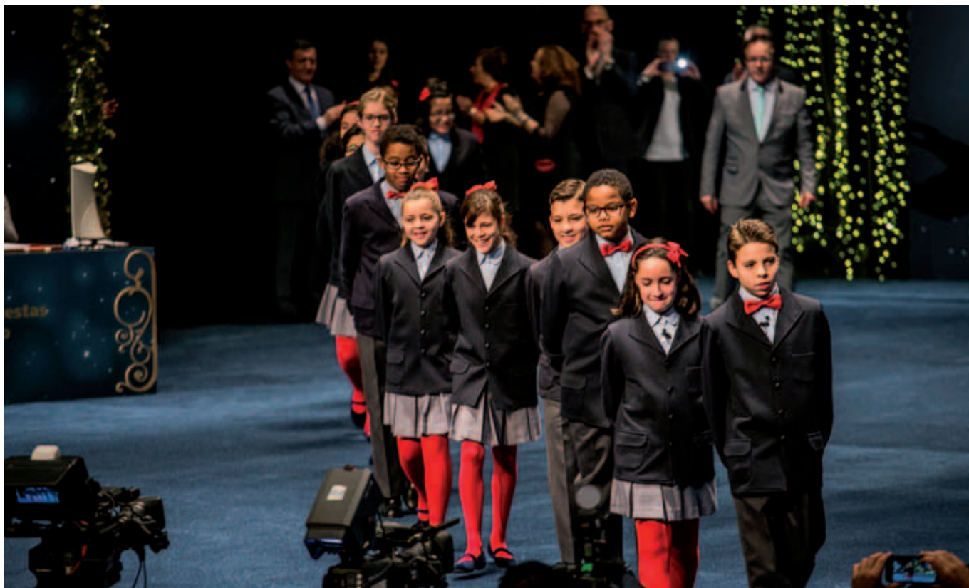
Los nervios y la emoción se reflejaban en las caras de los niños de San Ildefonso al salir al escenario del Teatro Real.

a Laujar de Andarax (Almería). Hasta allí llegó de la mano de los profesores y alumnos del Instituto de Educación Secundaria Emilio Manzano. Hasta ese momento, el primer premio de la Lotería de Navidad había caído cuatro veces en la provincia de Almería: una en la capital (1896), dos en El Ejido (2002 y 2012) y una en Tíjola (2007).