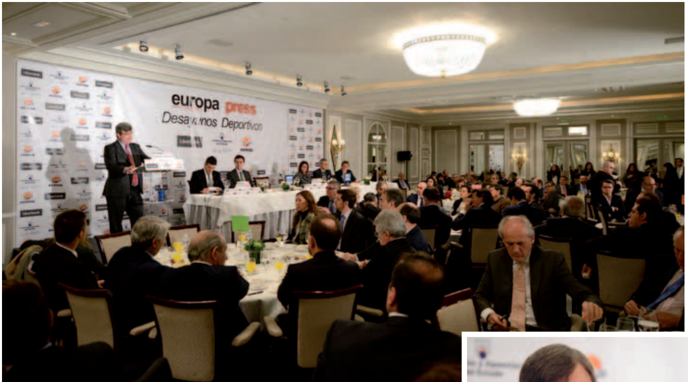
A la cita acudieron numerosas personalidades del panorama deportivo.