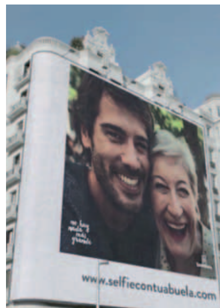
Lona en la que se exhibirá el selfie del ganador.