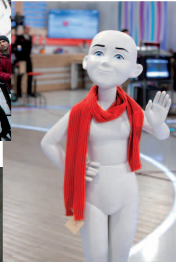
También el 10 de diciembre, en el plató de La mañana de La 1 , de Televisión Española.