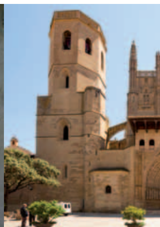
La Catedral es uno de los edificios más