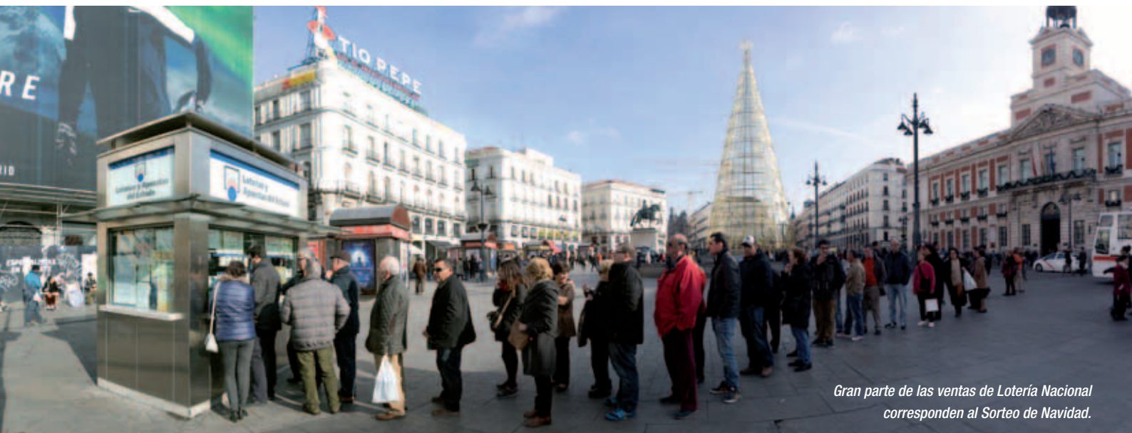
Gran parte de las ventas de Lotería Nacional corresponden al Sorteo de Navidad.

Por último, la venta online ha experimentado un aumento del 21% respecto al año anterior, alcanzando los 99,5 millones de euros; es decir, el 1,2% de las ventas totales de SELAE. El número de usuarios registrados en la web llegó a los 577.000, un 24% más que en 2014, y han jugado una media de 200.000 personas al mes.