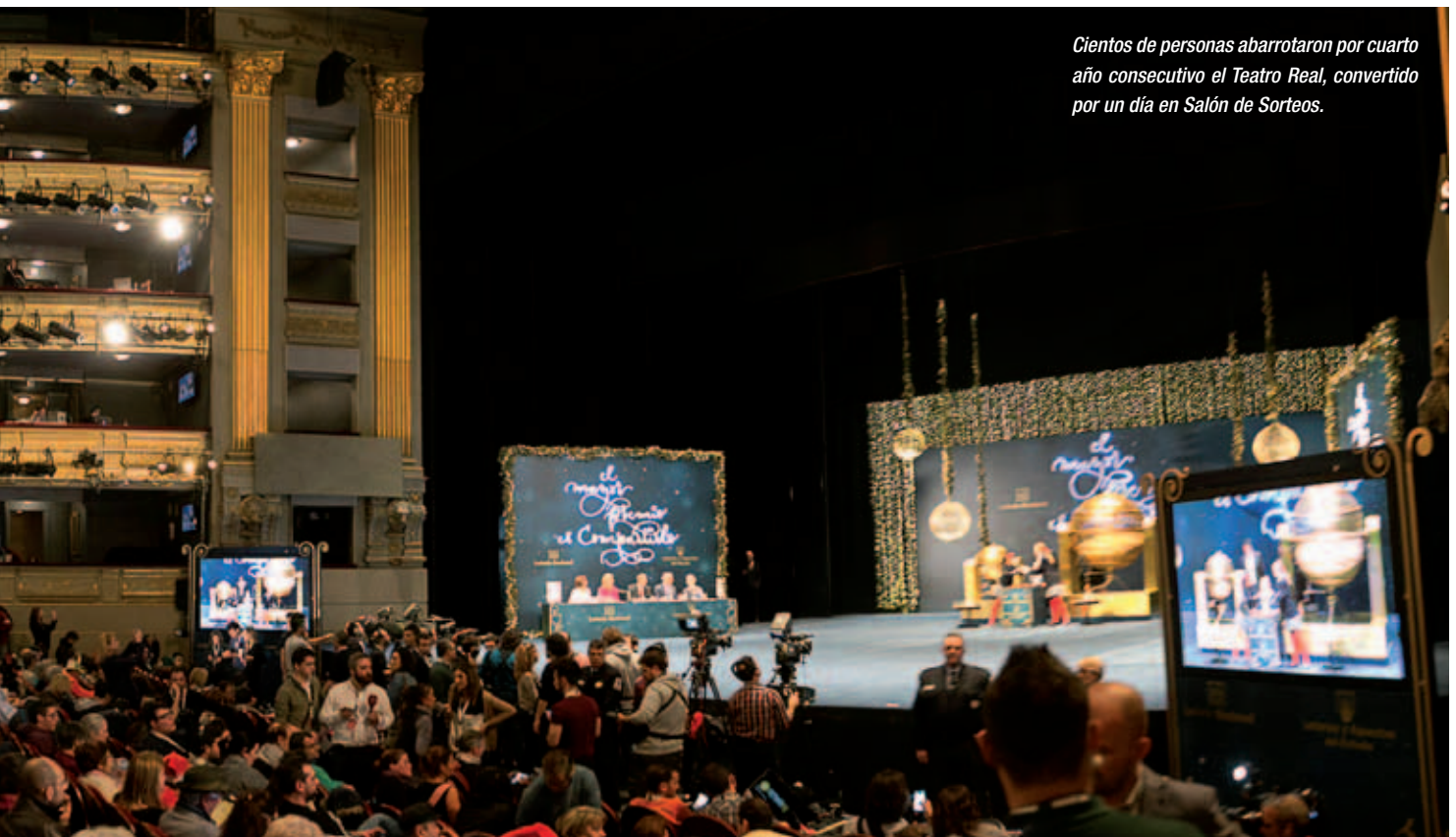
Cientos de personas abarrotaron por cuarto año consecutivo el Teatro Real, convertido por un día en Salón de Sorteos.