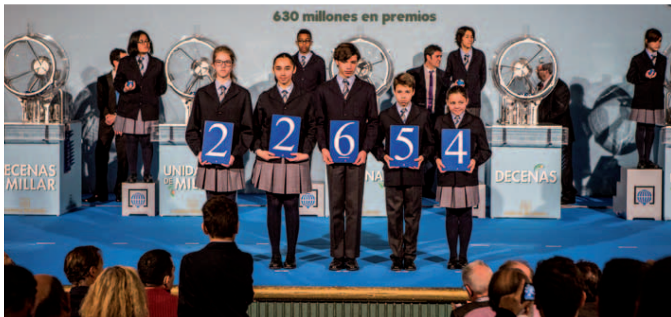
El Teatro Fernando de Rojas, situado en la segunda planta del Círculo de Bellas Artes, se convirtió por un día en el Salón de Sorteos de Loterías y Apuestas del Estado.