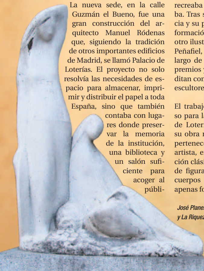
José Planes, La Fortuna y La Riqueza , 1963.