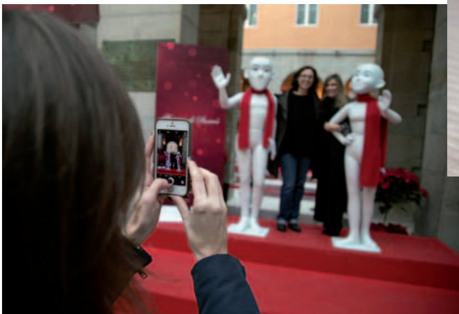
El 16 de diciembre, en la Real Casa de Correos, en la Puerta del Sol.