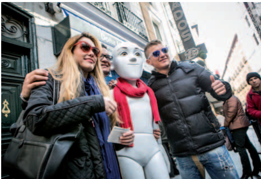
El 10 de diciembre, en la calle del Carmen nº 22, en pleno centro de Madrid.

Los personajes de la Fábrica El Pilar se dejaron ver por las calles de Madrid en los días previos al sorteo más esperado del año.