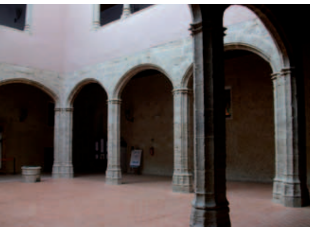
Interior del Castillo-Palacio de Alaquàs.

Después del Sorteo Extraordinario de "El Niño", celebrado el 6 de enero, le ha tocado el turno al de Invierno, el 16 del mis-