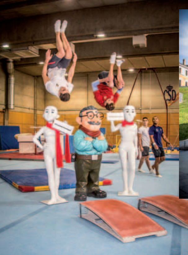
El 17 de diciembre, con el equipo español masculino de gimnasia artística, en el Centro de Alto Rendimiento del Consejo Superior de Deportes.

También el 18 de diciembre, en el plató de La suerte en tus manos , en La 2 de Televisión Española.