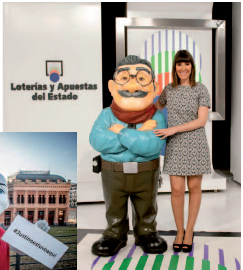
El 19 de diciembre, en la Estación de Atocha.