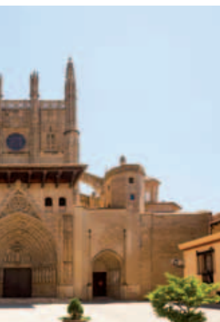
significativos de Huesca.

pasado—, y la gran novedad de 2016 será el Sorteo Extraordinario de "El Padre", el 19 de marzo. En ambos casos, el programa de premios será idéntico al del 16 de enero, con una emisión de 150 millones de euros y un precio de 150 euros por billete (15 euros el décimo).