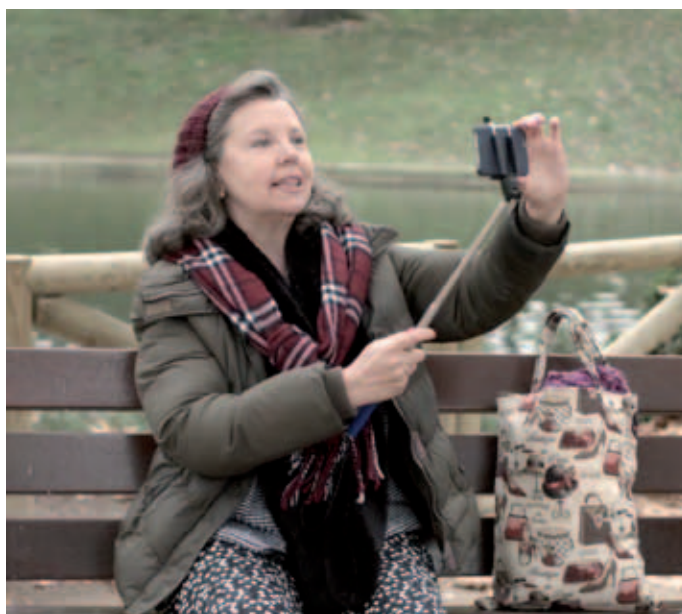
Una de las abuelas que aparecen en el spot de la promoción #SelfieConTuAbuela