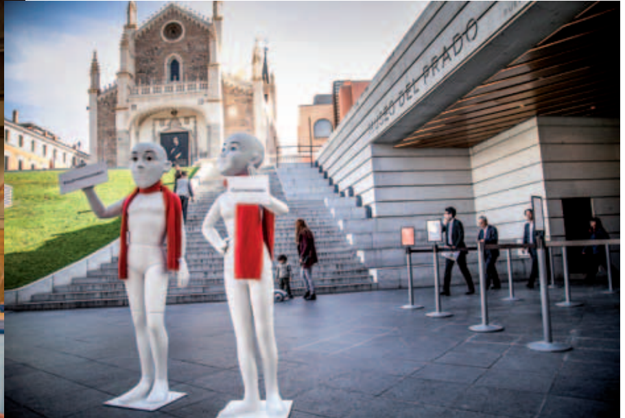
El 18 de diciembre, frente al Museo Nacional del Prado.

También el 18 de diciembre, en el plató de La suerte en tus manos , en La 2 de Televisión Española.