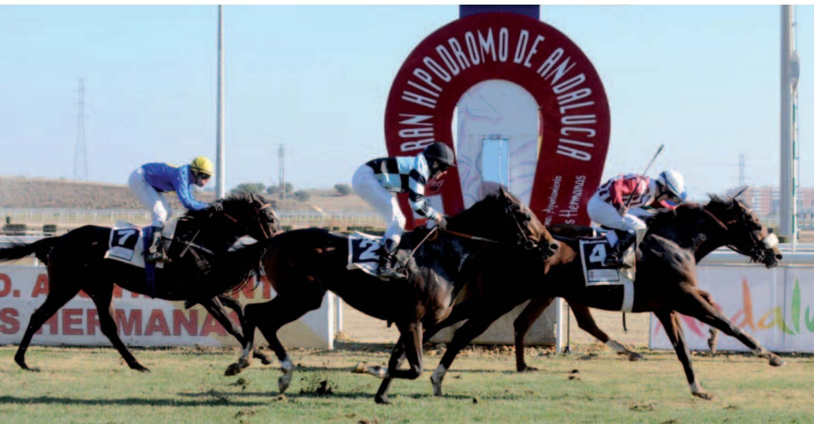
El Gran Hipódromo de Andalucía acogerá este año un total de 22 jornadas de carreras con apuestas Lototurf y Quintuple Plus.