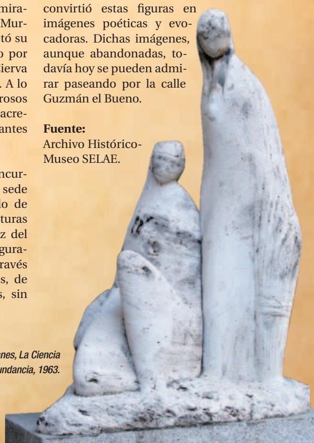
José Planes, La Ciencia y La Abundancia , 1963.