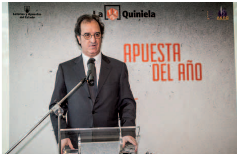
El Presidente de la AEPD, Julián Redondo, agradeció la iniciativa de SELAE.