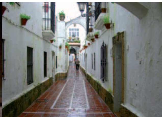
Calle típica de San Fernando, la antigua Villa de la Real Isla de León.