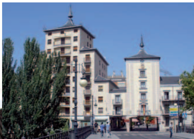
Ayuntamiento de Aranda de Duero, visto desde el puente.