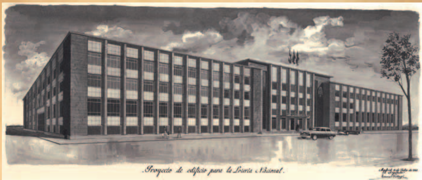
Manuel Ródenas, Proyecto de edificio para la Lotería Nacional, 1960.