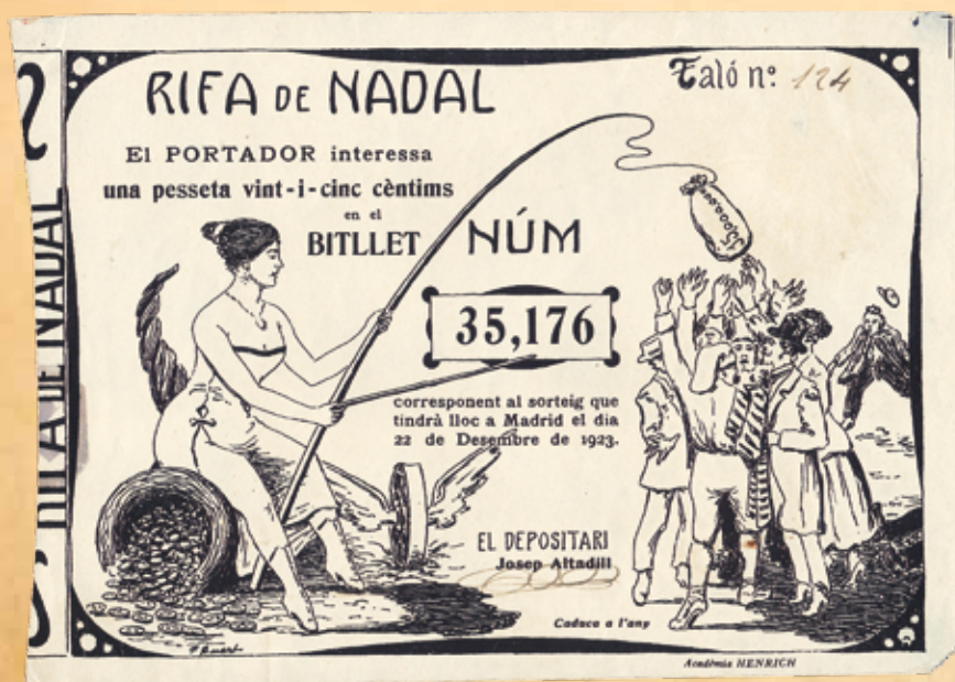
Participación de Lotería Nacional para la Rifa de Nadal, 1923.