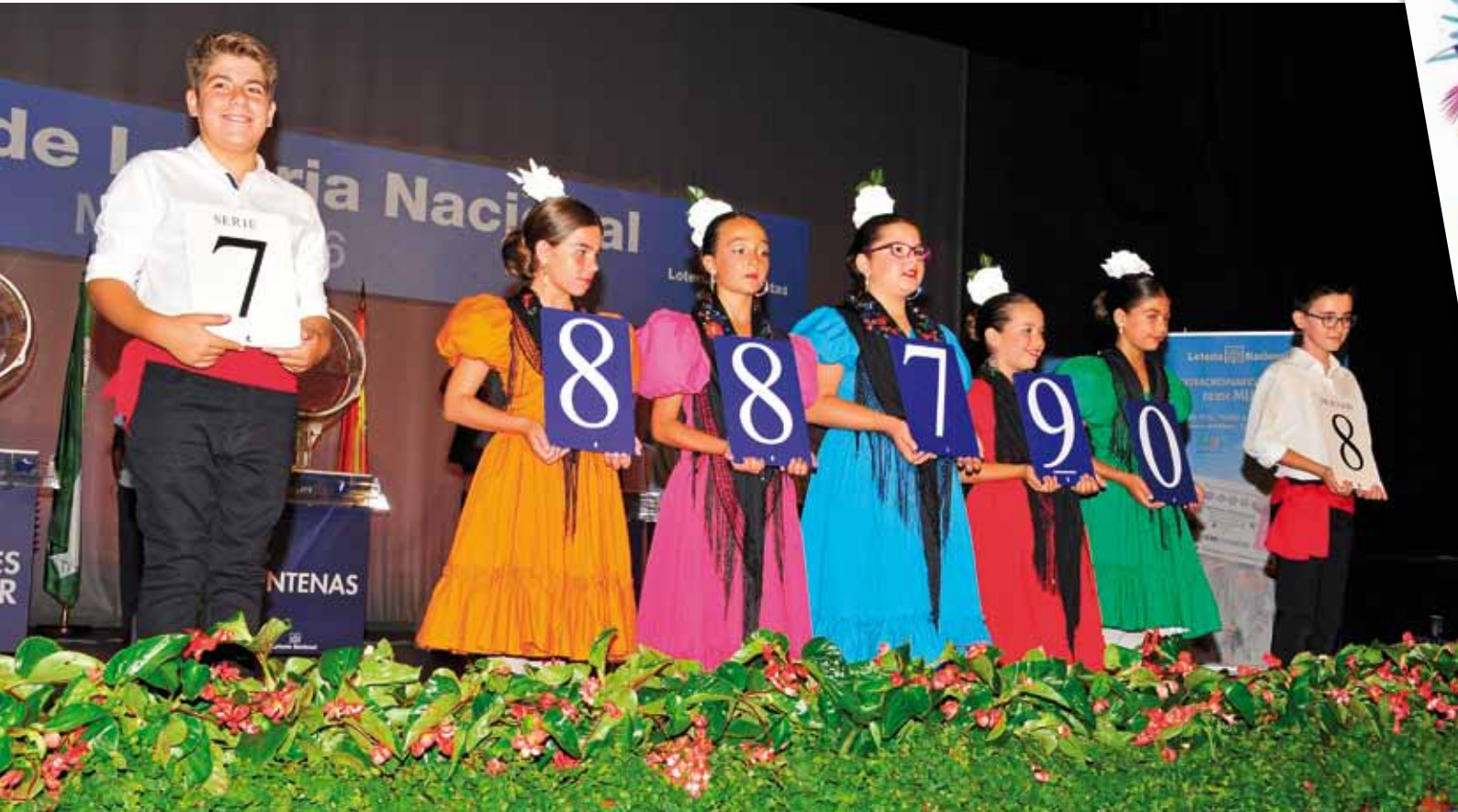
Niños mijeños, ataviados con los trajes típicos de la localidad, mostraron los números correspondientes al premio especial a un solo décimo.