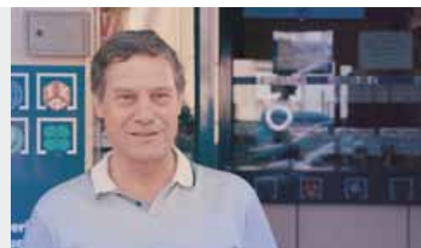
Seis imágenes correspondientes al vídeo rodado en Roquetas de Mar.