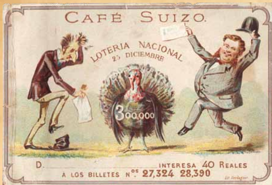
Participación de Lotería Nacional del Café Suizo para el sorteo de Navidad, finales del siglo XIX.