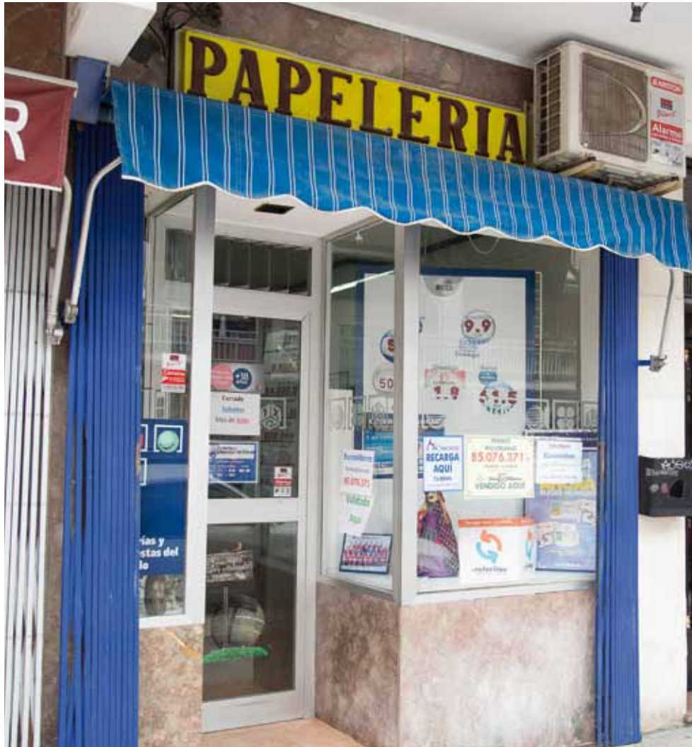
La papelería Gifer se encuentra en la calle Pablo Picasso nº 1 de Coslada (Madrid).

al que posteriormente se fueron sumando La Primitiva, BonoLoto, El Gordo de la Primitiva, El Quinigol, EuroMillones, Lototurf, Quíntuple Plus y, por último, la Lotería Nacional vendida por