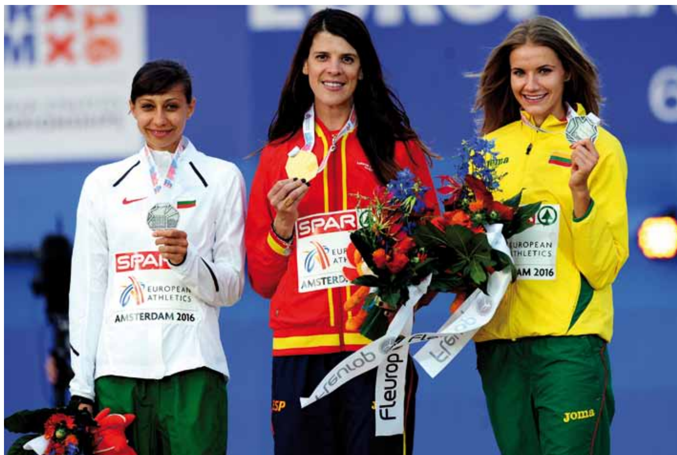
Ruth Beitía, en el centro, flanqueada por la búlgara Mirela Demireva y la lituana Airine Palsyte, ambas con medalla de plata.