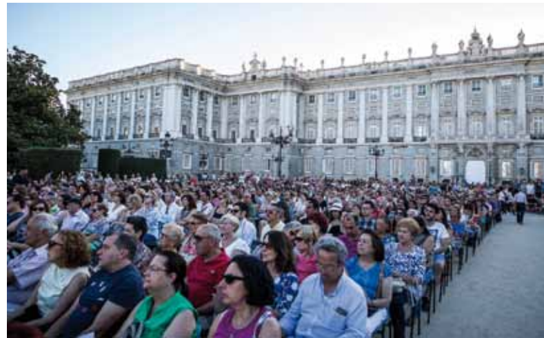
Miles de personas pudieron disfrutar al aire libre de la obra maestra de Vincenzo Bellini.