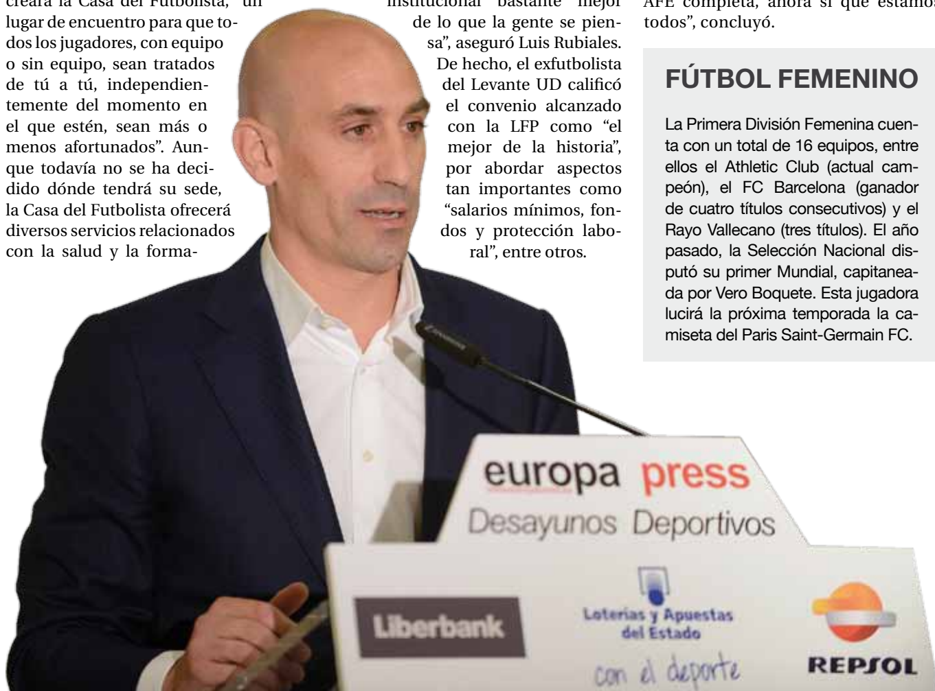
Luis Rubiales es el Presidente de la Asociación de Futbolistas Españoles desde 2010.

La Primera División Femenina cuenta con un total de 16 equipos, entre ellos el Athletic Club (actual campeón), el FC Barcelona (ganador de cuatro títulos consecutivos) y el Rayo Vallecano (tres títulos). El año pasado, la Selección Nacional disputó su primer Mundial, capitaneada por Vero Boquete. Esta jugadora lucirá la próxima temporada la camiseta del Paris Saint-Germain FC.