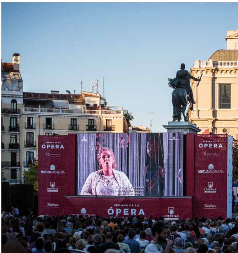
El público pudo seguir la ópera gracias a tres pantallas instaladas en la madrileña plaza de Oriente.

El Ayuntamiento de Madrid instaló cientos de sillas en la plaza de Oriente, pero los espectadores fueron muchos más.