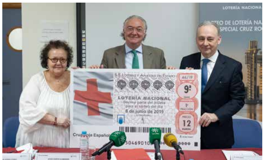
Descubrimiento de una placa conmemorativa (arriba), visita a distintos talleres (centro) y presentación del sorteo del 8 de junio (abajo), en la sede de Cruz Roja en Sevilla.