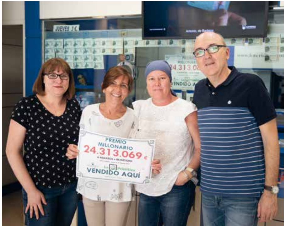
El premio de 24,3 millones de euros es el más alto que ha repartido la administración.

Con el paso del tiempo, “Lotería Cervantes” ha seguido repartiendo muchos premios. Hasta ahora, el más alto era de 1 millón de euros y correspondía al sorteo de El Millón del 3 de marzo de 2017. Ese premio fue a parar a una de las muchas peñas —en