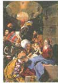
«LA ABRASION DE LOS REYES» Procedo del retablo mayor de San Pedro Martyr de Toledo, realizado hacia 1611 por Ray Juan B. Adams. Museo Nacional del Prado, Madrid