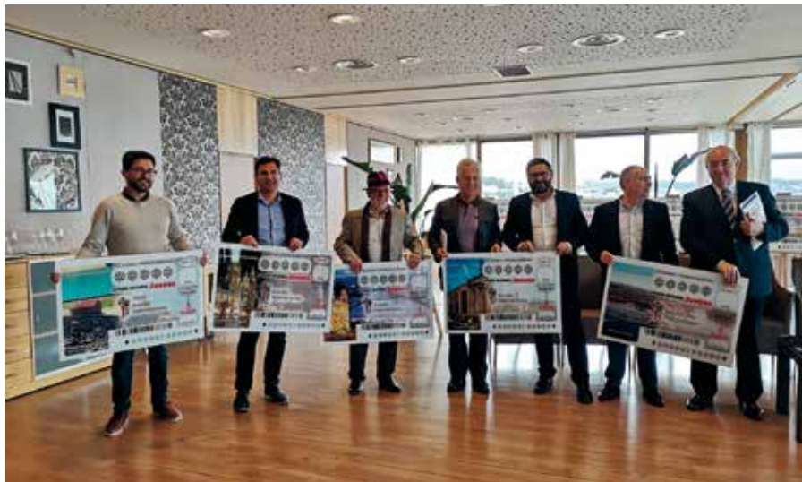
Presentación de la serie de décimos de Lotería Nacional dedicados a la Ruta del Padre Sarmiento.

Fray Martín Sarmiento (1695-1772) estableció una estrecha relación intelectual con el Padre Feijoo, del cual se convirtió en discípulo y colaborador. Junto a él