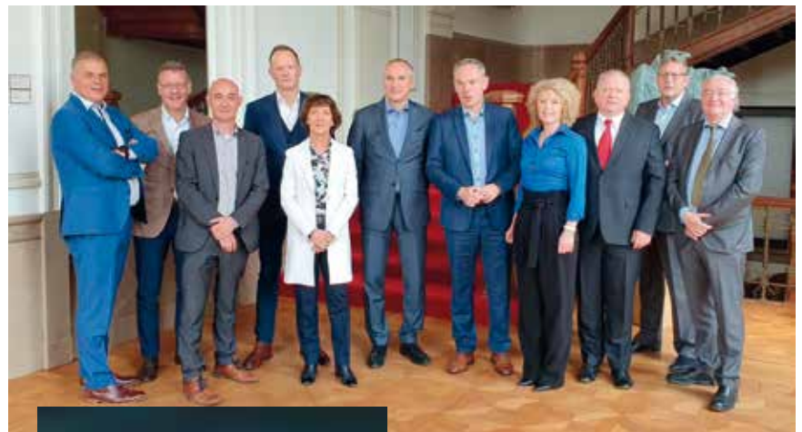
Comité Ejecutivo de The European Lotteries (arriba) y reunión de la Asamblea General (abajo).

La campaña constaba de un spot genérico de 45 y 30 segundos, y cuatro spots de 20 segundos enfocados al bote de La Primitiva. En cine se emitió también el spot genérico en formato de 71 segundos. Estas piezas se complementaban con cuñas de radio y apariciones en prensa, digital y redes sociales, así como en los propios puntos de venta.