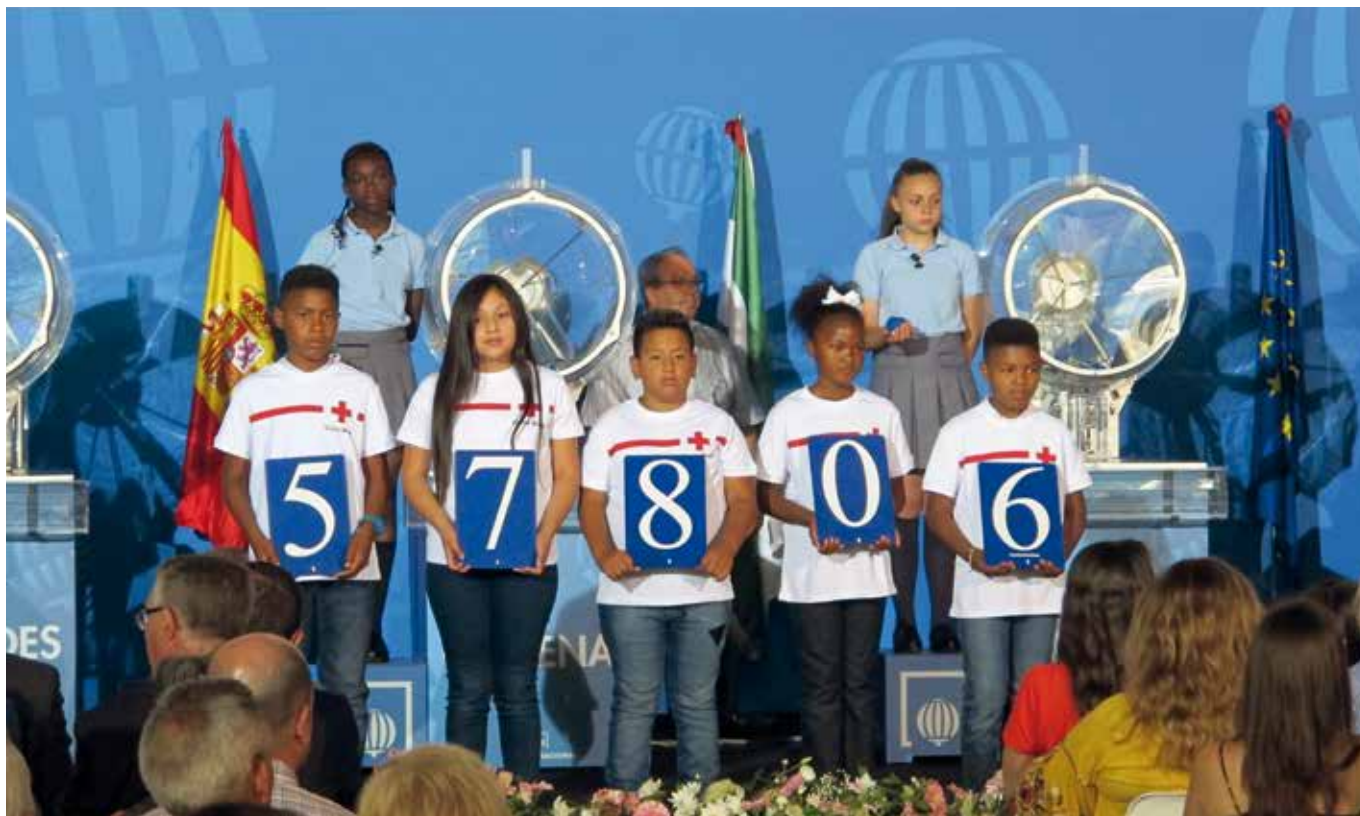
El Sorteo Especial Cruz Roja de este año se celebró en el interior del Pabellón de la Navegación de la capital andaluza.