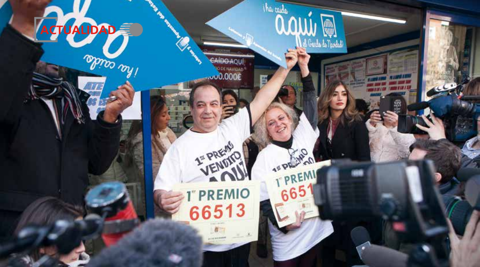
El Sorteo Extraordinario de Navidad es el más emblemático de Loterías y Apuestas del Estado.