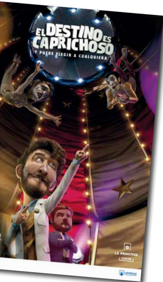
El Sr. ElDestino y su Secretario vuelven a protagonizar una campaña de La Primitiva.

Por lo tanto, el juego responsable volvió a situarse como uno de los valores de futuro de las loterías europeas.