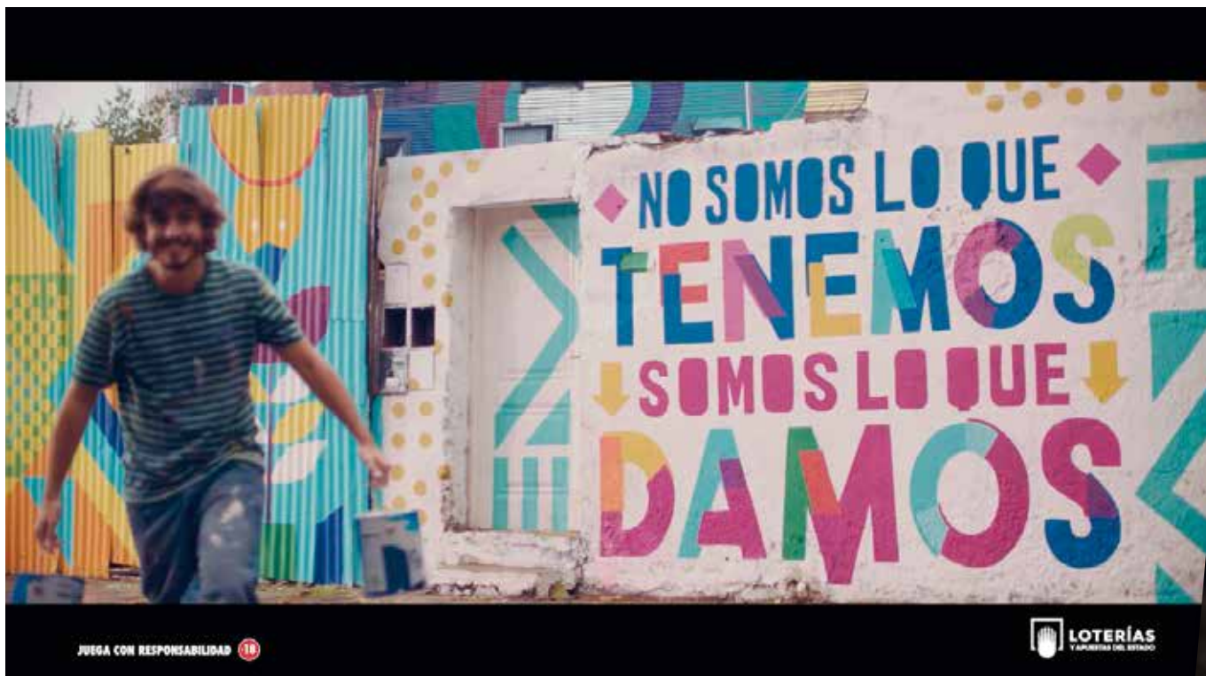
Repartir un bote de EuroMillones con las personas a las que queremos es un sueño hecho realidad en el spot de esta campaña.