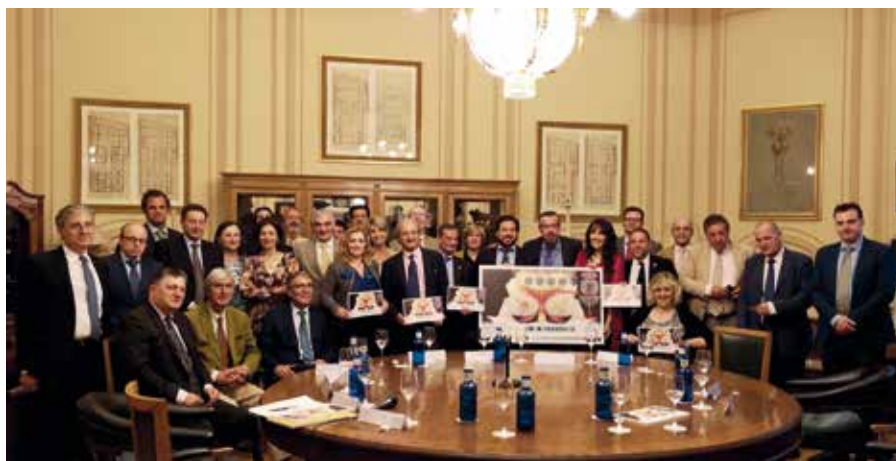
La presentación del décimo tuvo lugar en el Salón "El Torito" del Casino de Madrid.

Esta no era la primera vez que la Lotería Nacional se sumaba a una conmemoración relacionada con el vino, un producto tan importante en la economía española y que tanto reconocimiento ha obtenido fuera de nuestras fronteras. Los décimos del 3 de marzo de 2016 estuvieron dedicados a los 3.115 años de producción de vino en España, mientras que los del 25 de octubre de 2018 sirvieron para celebrar los 200 años del enoturismo español. Todo ello, con la colaboración de la plataforma Cata del Vino.