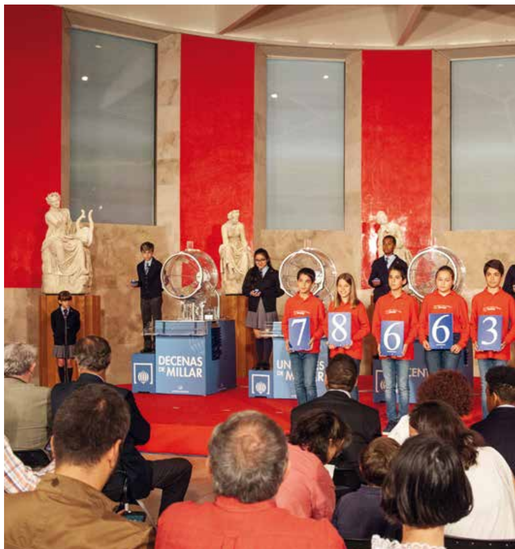
El primer premio fue a parar a las provincias de Ciudad Real, Valencia, Almería, Las Palmas y Soria.