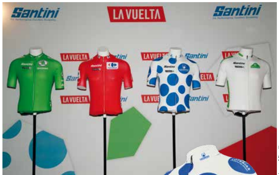
Los maillots verde, rojo, de lunares y blanco volverán a identificar a los campeones de la Vuelta a España.

Una de las jornadas más duras será probablemente la 9ª etapa, en cuyo perfil destacan como un tridente el Coll d'Ordino (1.980 m), el Coll de la Gallina