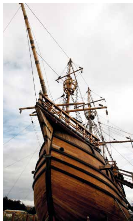
Réplica de la nao Victoria .

La expedición dirigida inicialmente por Magallanes bordeó la costa de América del Sur en busca de un paso hacia el océano Pacífico y, tras encontrarlo, puso rumbo al Sudeste Asiático. Magallanes murió en Filipinas en 1521 y tuvo que ser sustituido por Elcano. Bajo su mando, la expedición llegó a las islas Molucas —famosas por sus especias— y regresó a España cruzando el océano Índico y bordeando el continente africano.