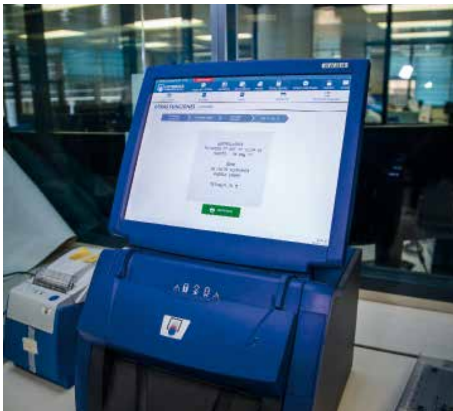
El TAP trabaja para que los recursos de los que dispone la red comercial estén operativos al 100%.

Precisamente, uno de los valores de la asistencia al punto de venta es su trato cercano, de ahí que, como nos cuenta Olga Villa, “Loterías se haya negado a utilizar contestadores automáticos que, aunque estuvieran de moda, no nos acercan al punto de venta”. Por el con-