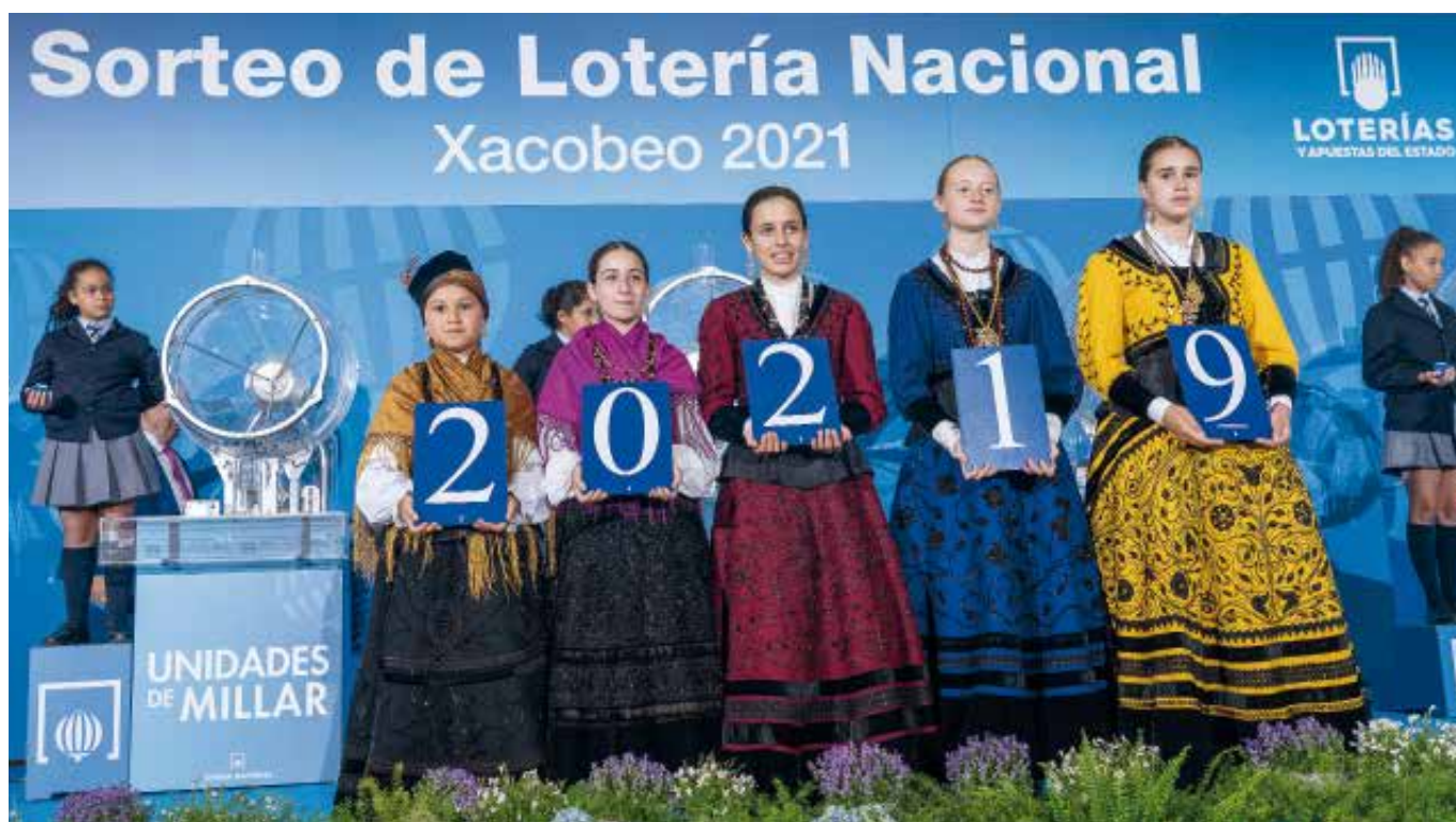
El primer premio del Sorteo Viajero celebrado en Santiago de Compostela correspondió al número 20.219.

San Ildefonso han estado acompañados por representantes de la Agrupación Folclórica Colexiata do Sar.