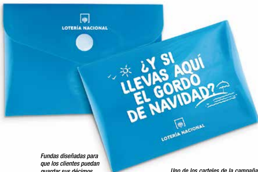
Fundas diseñadas para que los clientes puedan guardar sus décimos.

Y como en verano aumentan considerablemente los desplazamientos por carretera, se van a insertar formatos personalizados en las rutas de Waze —una de las principales apps de asistencia en viaje—, señalando en el mapa los puntos de venta de Loterías y recordando a los usuarios que el Gordo puede estar a la vuelta de la esquina.