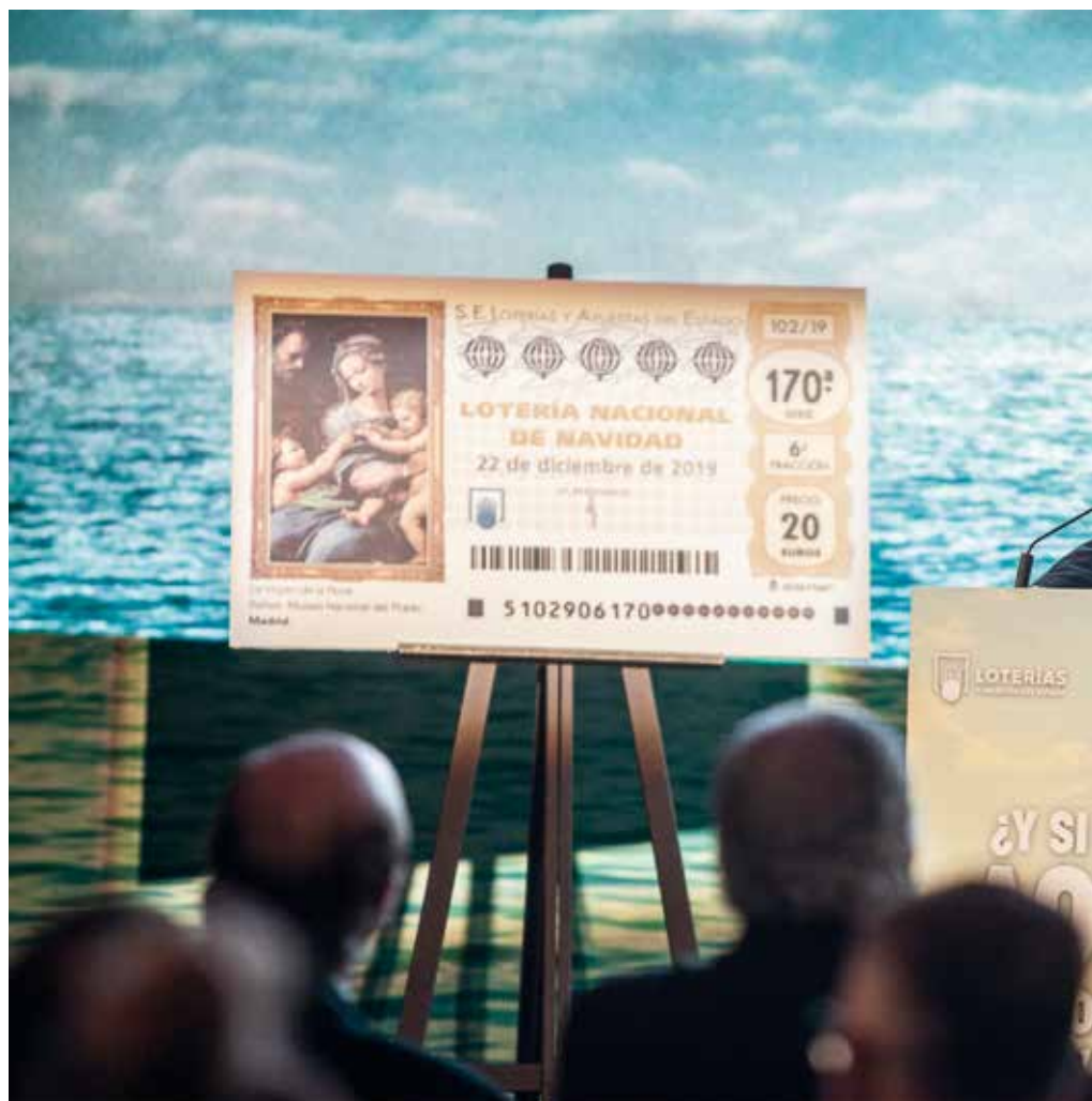
El Presidente de Loterías, Jesús Huerta, explicó los detalles del Sorteo Extraordinario de Navidad de 2019.

Al igual que en las dos últimas ediciones, la emisión del Sorteo de Navidad de 2019 consta de 170 series de 100.000 números cada una. Como el precio de los décimos y resguardos sigue siendo de 20 euros (200 euros el billete), el valor de la emisión asciende a un total de 3.400 millones de euros. De esa cifra, el 70% —es decir, 2.380 millones de euros— se repartirá en premios. Como es habitual,