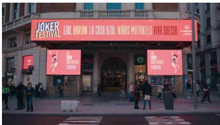
La campaña “Joker Festival” obtuvo cuatro Soles de bronce.

En la ceremonia de entrega, celebrada en Madrid, varias campañas de Loterías y Apuestas del Estado se alzaron con alguno de los preciados galardones. En primer lugar, la campaña “22 otra vez”, creada por Contrapunto BBDO para el Sorteo de Navidad de 2018, consiguió un Sol de Plata en la categoría Film . Por su parte, la campaña “Joker Festival”, realizada por Proximity Madrid para el juego asociado a La Primitiva, obtuvo cuatro Soles de Bronce: dos en Activación y Experiencia de Marca, uno en Branded Content y uno en Exterior. Finalmente, “Regalos con mensaje”, la campaña de Contrapunto BBDO para el Sorteo de San Valentín de 2019, consiguió un Sol de Bronce en el apartado Film .