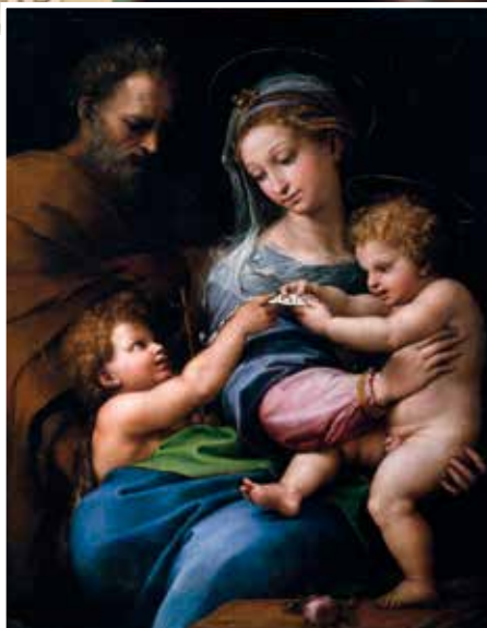
Los décimos de Navidad están ilustrados con una obra de Rafael que se conserva en el Museo del Prado.