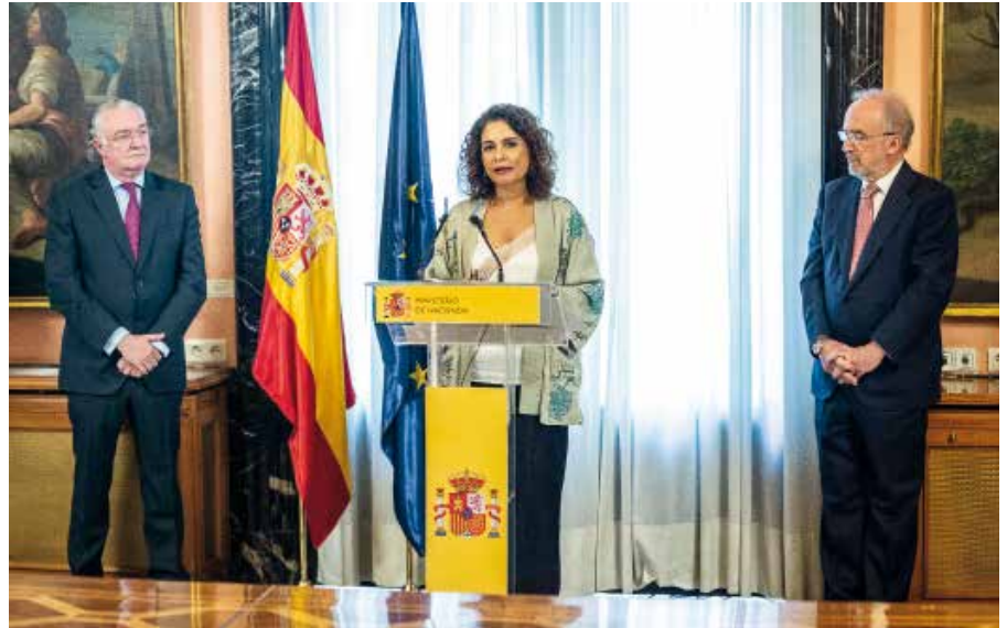
La Ministra de Hacienda en funciones, acompañada del Presidente de Loterías y el Director de la RAE.