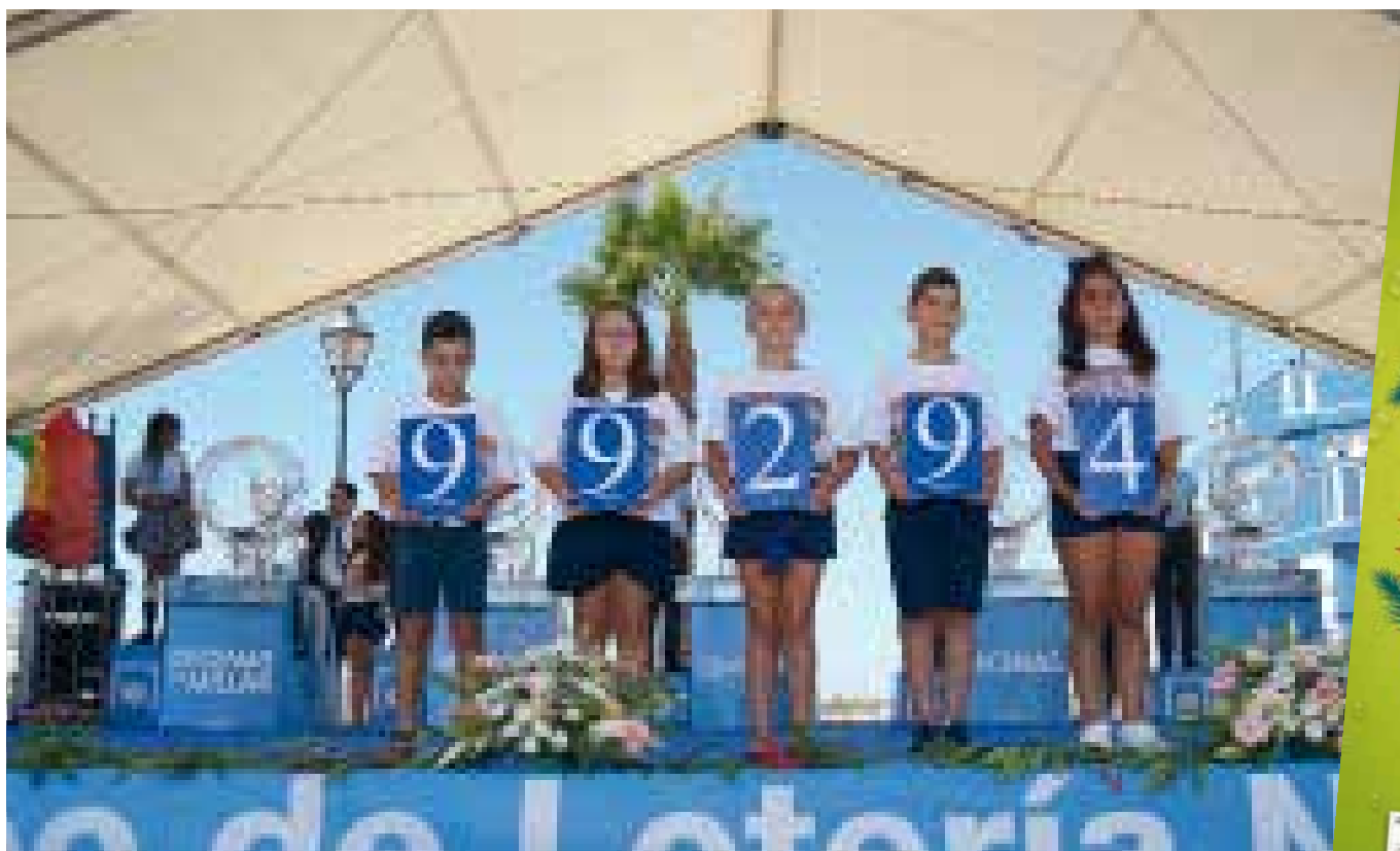
El 99.294 fue el número agraciado con el primer premio en el sorteo de Lotería Nacional del 6 de julio, celebrado en Ayamonte (Huelva).