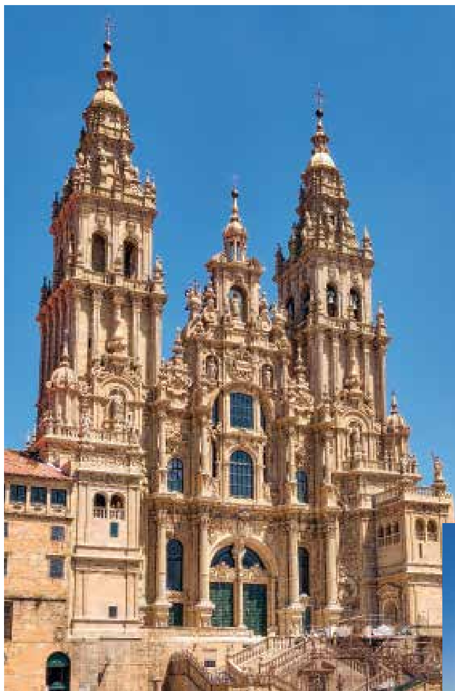
La Catedral de Santiago de Compostela es la meta a la que aspiran todos los peregrinos.

El Sorteo Viajero del 20 de julio estuvo dedicado al próximo Año Santo.