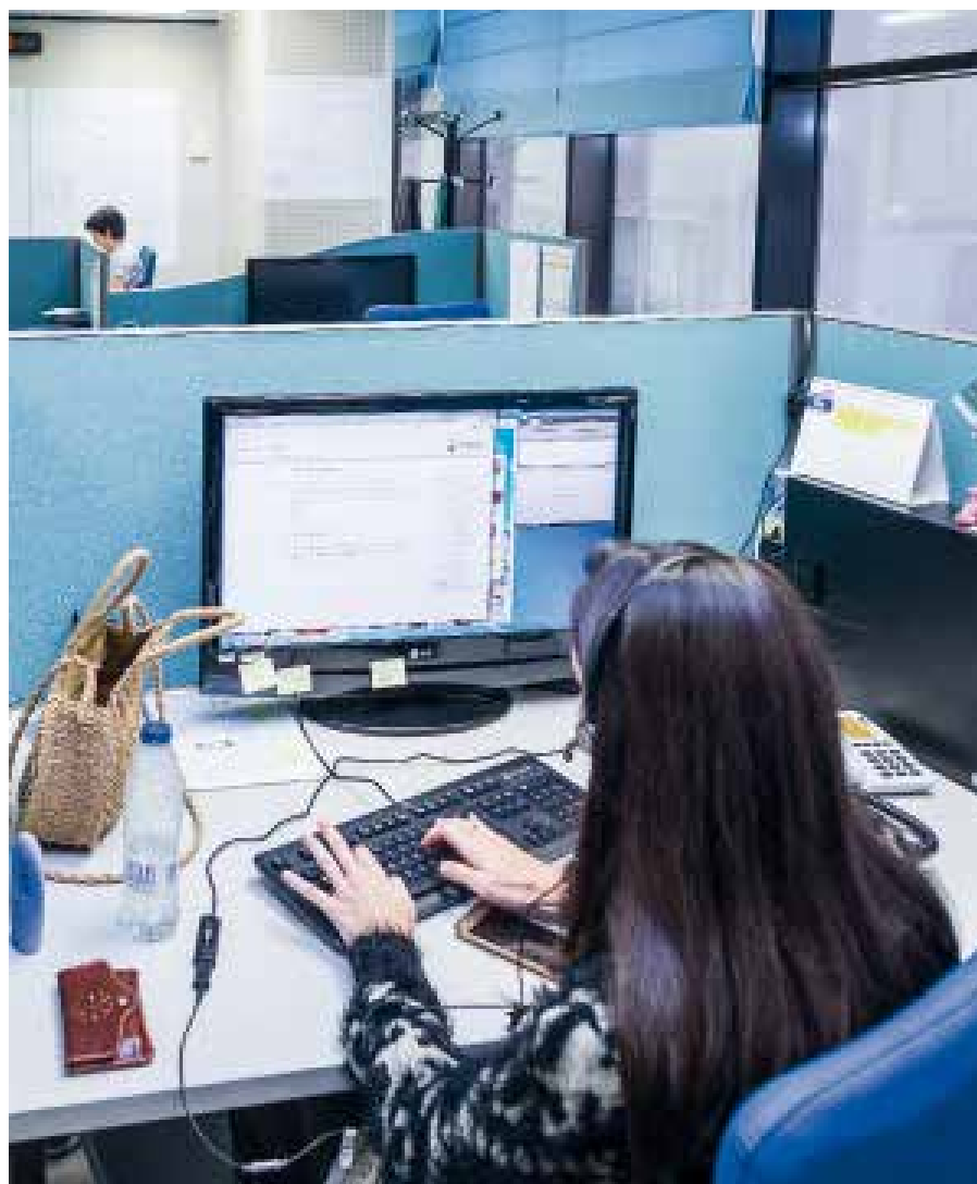
El TAP presta servicio a los puntos de venta y las delegaciones de Loterías y Apuestas del Estado.

Tanto el TAP como el CAU forman parte, junto con la unidad de Control Opera-