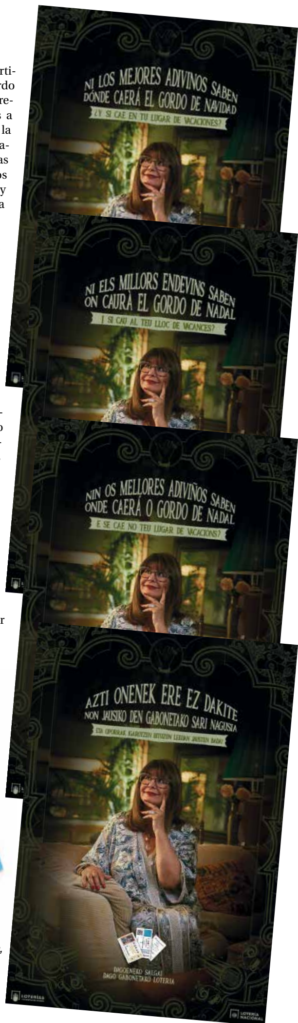
Uno de los carteles de la campaña, en las distintas lenguas oficiales.